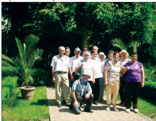
Pensionarii din Agnita ar vrea o relație mai bună cu Casa de Asigurări de Sănătate