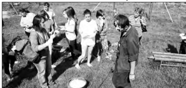
Tinerii au lucrat mai multe săptămâni la proiectul lor

Voluntarii de la trei școli medieșene au reamenajat parcul de pe strada Valea Adâncă, din cartierul Moșnei. Timp de mai multe săptămâni, zona a fost ecologizată, s-au plantat flori și arbuști, s-au montat bănci, coșuri de gunoi, panouri informative și un suport pentru biciclete.