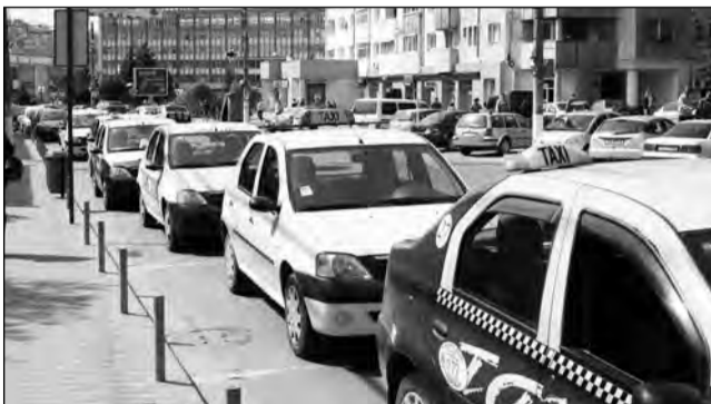
Plimbările cu taxiul costă, la Mediaș, 1,79 lei pe kilometru