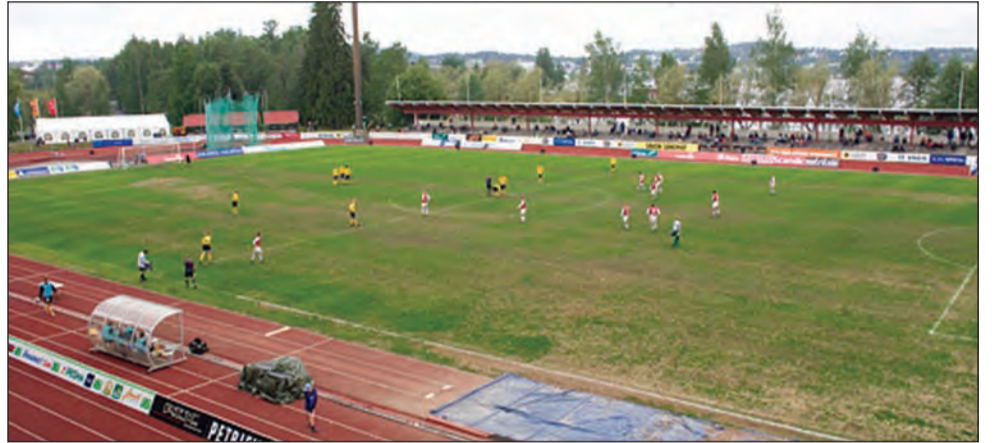
Gaziștii vor începe aventura europeană pe micuțul stadion de la Kuopio

Finlanda, iar campionatul a fost câștigat de formația HJK Helsinki. În acest sezon, echipa merge prost, având doar trei victorii după 11 partide. Din lot fac parte trei jucători nige-