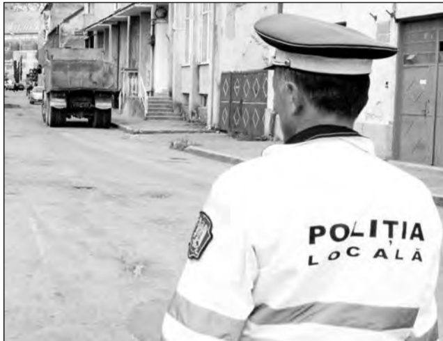
Polițiștii locali găsesc salarii de sute de euro doar peste hotare

Oamenii legii lucrează în ture de câte 12 ore, un ritm de lucru aproape inuman. Cu tot cu turele de noapte, salariul mediu abia le ajunge la 600-700 lei. Lesne de înțeles, acesta este principalul motiv pentru care ei caută un loc de muncă mai bine plătit. „Din informațiile noastre, mai sunt și alți polițiști care își caută un loc de muncă în alte parte, deoarece cu veniturile actuale nu își pot întreține familiile”, spune verde-n față Ilarie Sideriaș. În plus, legea nu prea permite angajări. „Hotărârea de Guvern nr. 34 precizează că poate fi angajată o persoană la șapte plecate, deci 15% din posturile care se vacantează